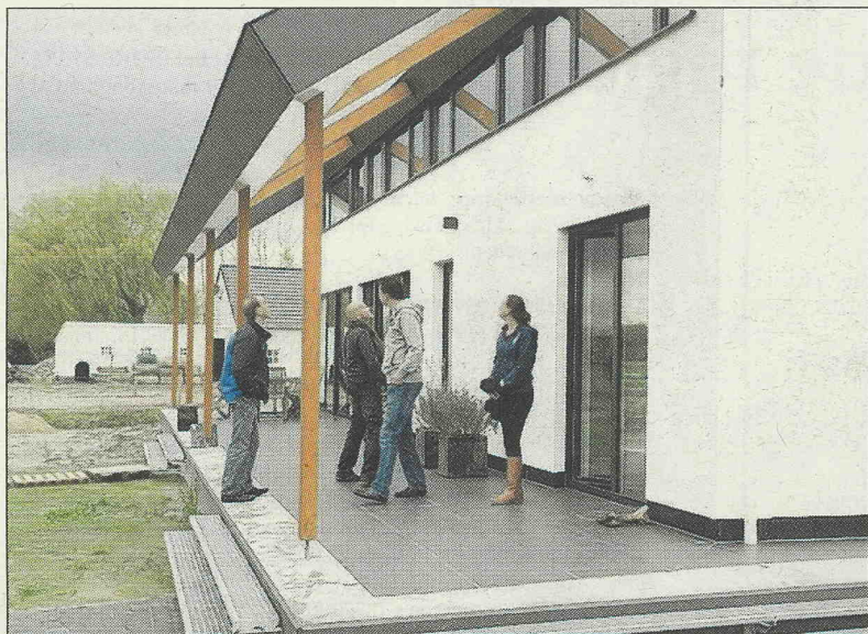
Bezoekers bekijken in Oijen het passief energie huis, waar het dak is 'uitgeknijpt' voor opvang van meer zonlicht.